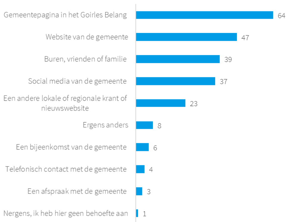
Figuur 1. Vraag 1: Waar haal je informatie vandaan over waar de gemeente Goirle zich mee bezig houdt? Meerdere antwoorden mogelijk. (n = 721 / %)

Allereerst vroegen we de respondenten waar zij hun informatie over de gemeente Goirle vandaan halen. Bijna twee derde van de respondenten haalt hun informatie van de gemeentepagina in het Goirles Belang (64%). Ongeveer de helft haalt haar informatie van de gemeentewebsite (47%). Ook via vrienden, burens of familie (39%) of via de gemeentelijke sociale media (37%) verkrijgt een aanzienlijk deel van de inwoners haar informatie over de gemeente. Slechts 1% haalt deze informatie niet, aangezien zij hier geen behoefte aan hebben.