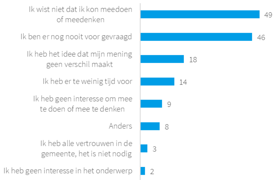
Figuur 2. Vraag 7: Waarom heb je nooit met de gemeente meegedaan aan of meegedacht over een plan of project? Meerdere antwoorden mogelijk. (n = 295)*

*Ingevuld door respondenten die in de afgelopen 2 jaar niet meegedaan of meegedacht hebben met plannen of projecten van de gemeente.